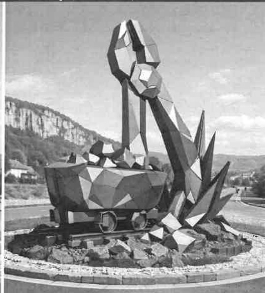
Option 2 : Style Moderne