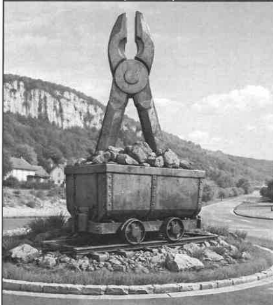
Option 1 : Héritage Industriel