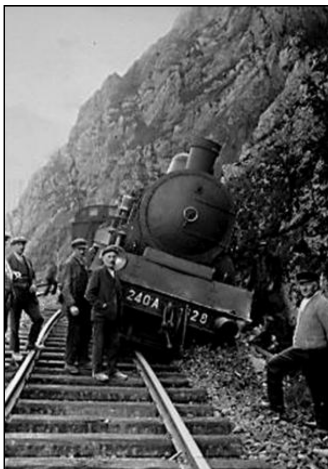
La locomotive couchée le long de la paroi