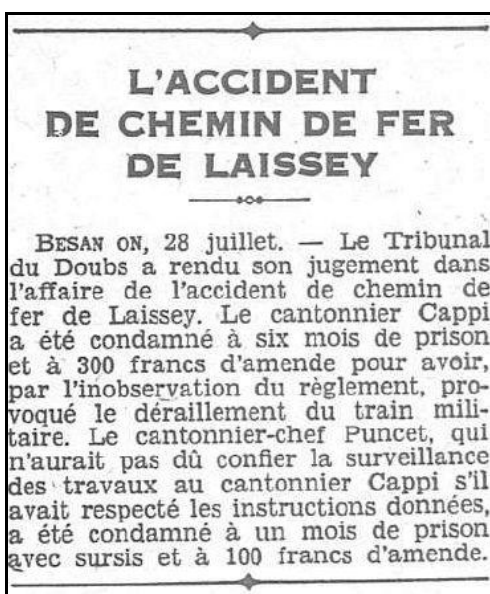
Les lampistes sont toujours les mêmes