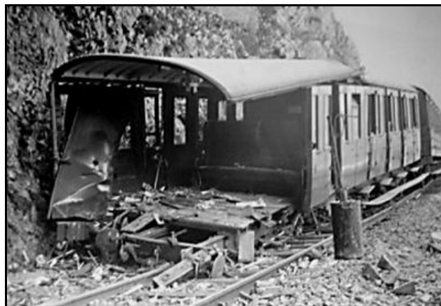
Cette photo montre bien l'encastrement des voitures en bois