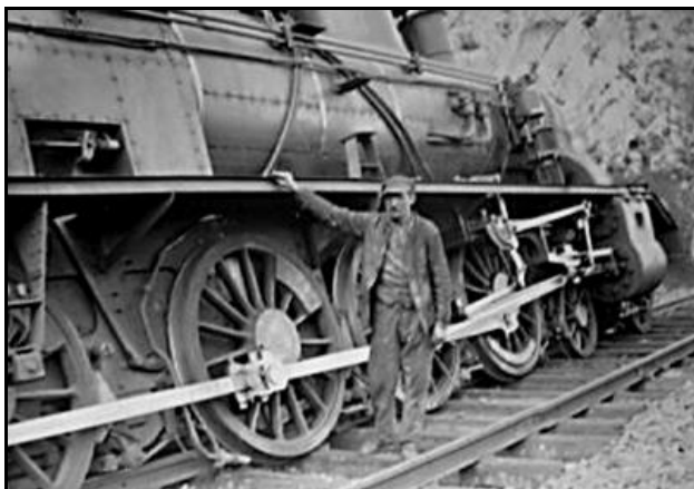
Le mécanicien du train