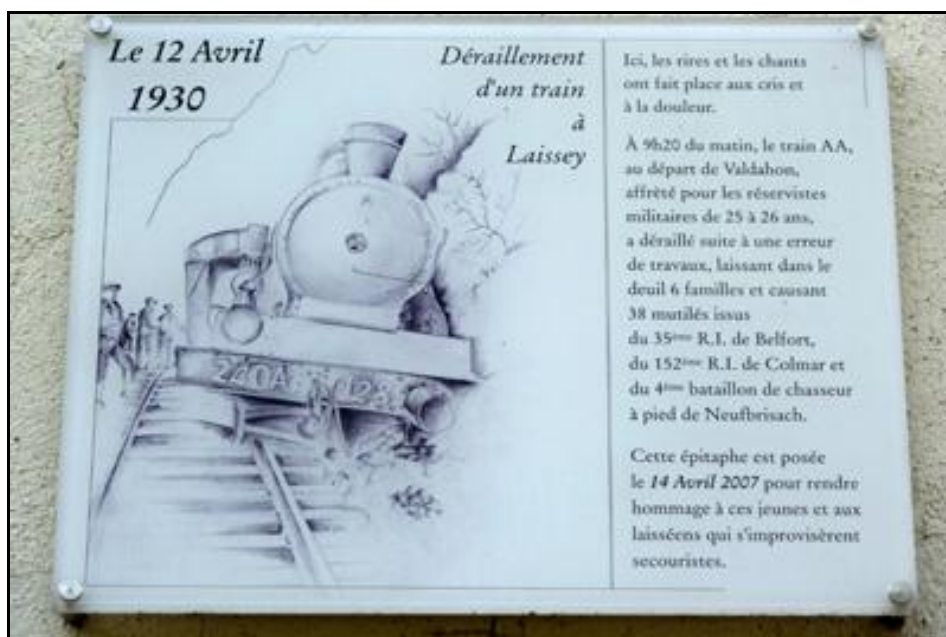
Plaque souvenir apposée à la sortie du tunnel avec une légère erreur de date L'accident s'est produit la veille du jour indiqué